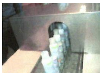
シュリンク包装(オンパック)