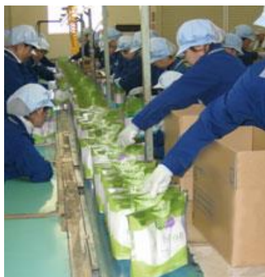
化粧品セトライン

・当社の所有する第一倉庫、新宿倉庫、ビジネスパーク、宿東倉庫、圏央坂戸インター北倉庫、青木野積倉庫、京都出張所については、他社と不動産賃貸契約で全貸しているため認証・登録範囲外。