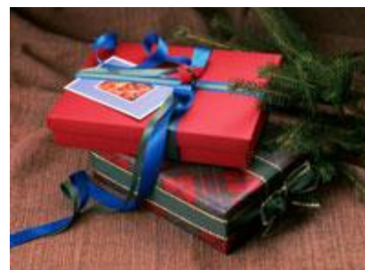
ギフト商品などの詰合せ